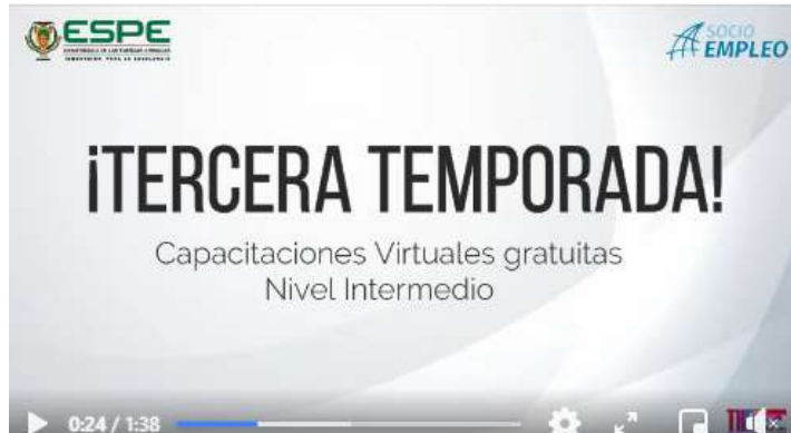
Afiches promocionales de los temas del Proyecto de Vinculación con la sociedad III Etapa. Tomado de la página oficial de Facebook de la Universidad de las Fuerzas Armadas Espe-Latacunga (03-03-2021)